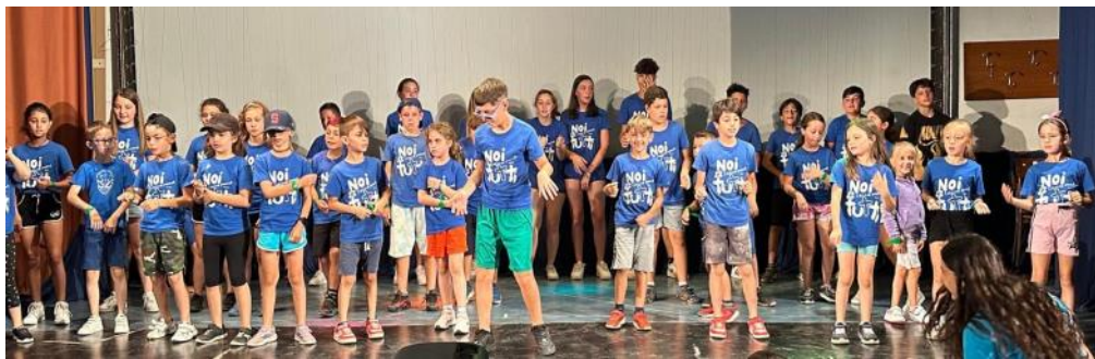
San Carlo - Altopiano