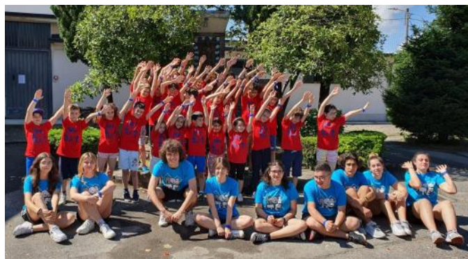
Oratorio San Paolo VI