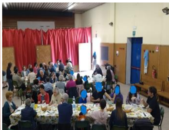
Tutti a tavola

(chi fosse interessato può trovare informazioni sul sito https://azionecattolicamilano.it/ )