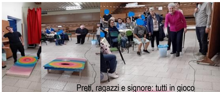
Prete, ragazzi e signore: tutti in gioco