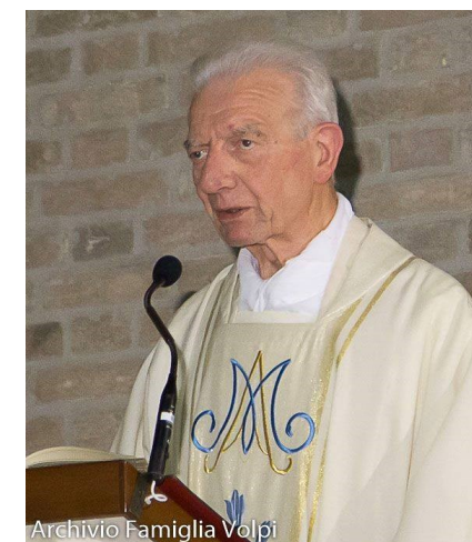
Archivio Famiglia Volpi

la S. Messa sarà celebrata alle ore 21.00 e sarà in suffragio di don Luigi Zanaboni, già nostro Parroco dal 1989 al 2009. La S. messa plurintenazionale è spostata al mese successivo.